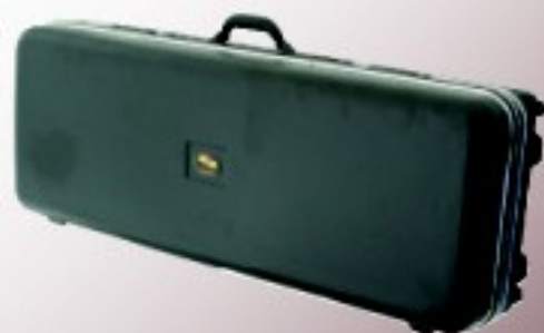
Baryton (avec roulettes)